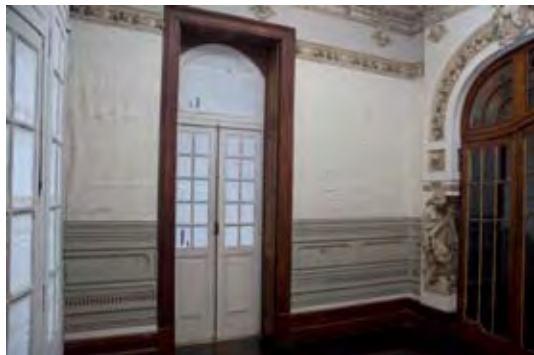
SALA EM BRANCO, 2008 | SALA EN BLANCO | BLANK ROOM