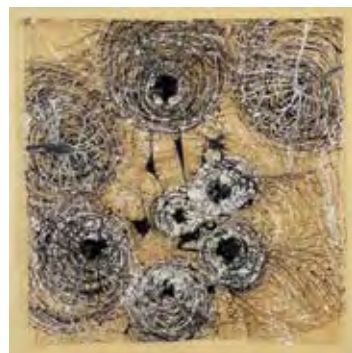
TEIA, 1994 | TELARAÑA | WEB tinta escorrida sobre plástico transparente 107 x 107 cm

A genealogia da obra de Helena Trindade se origina pontualmente na imagem e na palavra. Na imagem via pintura, pela plasticidade da construção e suas especificidades materiais. Na palavra pela poesia, cuja entrada se dá pela modernidade de Apollinaire (1880–1918), que insuflou com seus caligramas um caminho que se propunha superar a disjunção clássica entre imagem e texto. A proximidade e o diálogo de Apollinaire com os pintores modernos permitiu essa abertura do poema para a imagem através das artes plásticas. Isso fica mais claro à medida que Mallarmé (1842–1898), de outro lado, com seu lance de dados , chega à imagem através da própria estrutura do poema: palavra e espaço da página em branco. Essa genealogia delineada proporciona cruzamentos e interseções históricas, que, no caso de Helena Trindade, vão diretamente ao encontro da produção de artistas/poetas, como Joan Brossa e Nicanor Parra, cuja obra extrapola a dimensão do objeto/palavra ou do chamado poema-objeto. Segundo Adolfo Montejo Navas, trata-se de “ una tridimensionalidad nueva de la poesía expandida ,